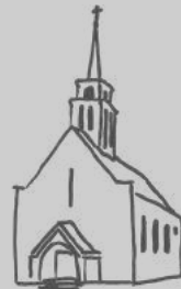
Neustadt—Sebnitz St. Gertrud