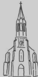
Pirna St. Kunigunde