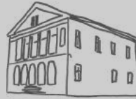
Bad Schandau—Königstein Maria, Mittlerin aller Gnaden