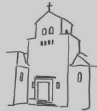
Heidenau St. Georg