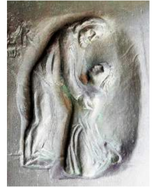
Bild: Friedbert Simon (Fotografie) / Roland Friederichsen (Künstler) / In: Pfarrbriefservice.de

Pirna : jeden Donnerstag um 8.00 Uhr Pfarrkirche