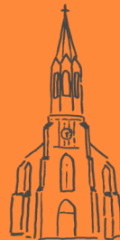
Pirna St. Kunigunde