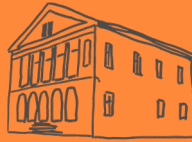
Bad Schandau—Königstein Maria, Mittlerin aller Gnaden