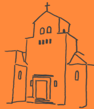
Heidenau St. Georg