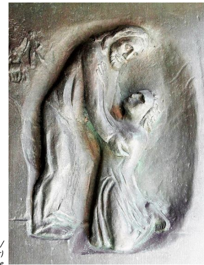
Bild: Friedbert Simon (Fotografie) / Roland Friederichsen (Künstler) In: Pfarrbriefservice.de

Pirna: jeden 1. Donnerstag im Monat um 17.30 Uhr (Pfarrkirche)