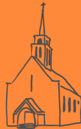
Neustadt—Sebnitz St. Gertrud