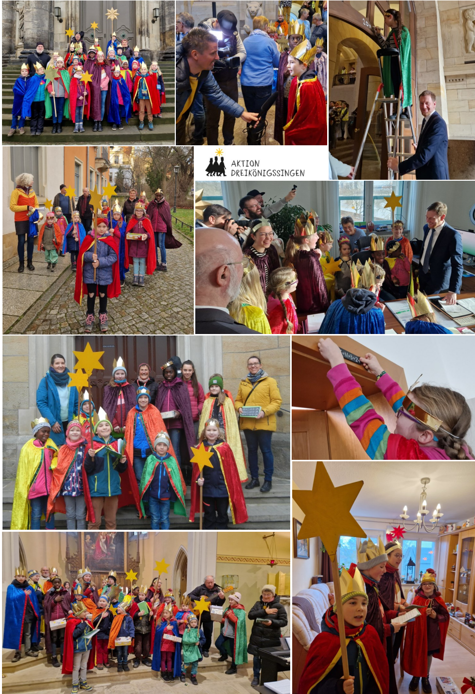
Bilder: Cornelia Ahlswede