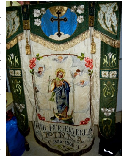
Fahne des katholischen Bürgervereins Pirna.