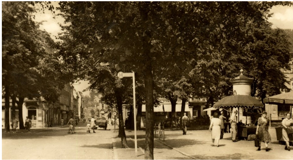
Alte Aufnahme vom Dohnaischen Platz aus